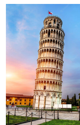
TORRE DE PISA