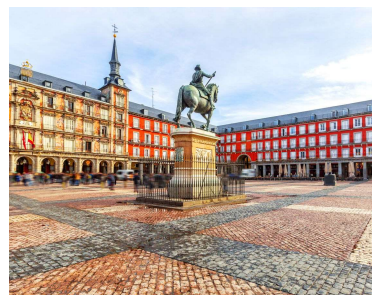
PLAZA MAYOR, MADRID.

12 DE ABRIL - MADRID. Llegada a Europa. Bienvenidos a España. MADRID. Traslado al hotel. Por la tarde tendremos una visita panorámica durante la cual conoceremos los puntos monumentales más atractivos. Por la noche incluimos un traslado paseo a la Plaza Mayor, donde podemos aprovechar para tomar unos vinos en algún mesón.