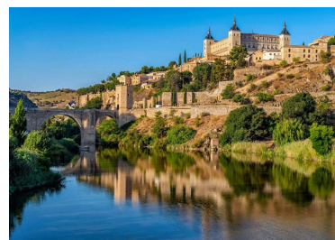
RÍO TAJO, TOLEDO.

13 DE ABRIL - MADRID - TOLEDO - MADRID. Incluimos una excursión a la histórica ciudad de TOLEDO, protegida por el río Tajo. Sus calles medievales nos hablan de historias de cristianos, judíos y musulmanes. Tarde libre en MADRID. Esta noche, si lo desea, le proponemos opcionalmente un espectáculo flamenco.