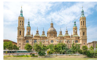
BASÍLICA DEL PILAR, ZARAGOZA.

14 DE ABRIL - MADRID - ZARAGOZA - BARCELONA. Salimos hacia Aragón atravesando tierras de Castilla. En ZARAGOZA nos detenemos brevemente para conocer la Basílica del Pilar. BARCELONA, llegada y breve panorámica en autocar por sus principales arterias para familiarizarnos con la capital catalana. Nota: (En ocasiones la visita puede realizarse en la mañana del día siguiente.)