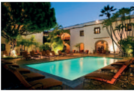
HODELPA NICOLÁS DE OVANDO