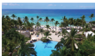
VIVA DOMINICUS BEACH