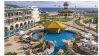
OCEAN EL FARO