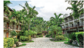
GRAN JIMENOA HOTEL