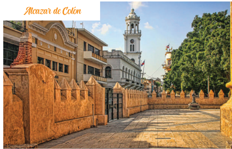
Alcazar de Colón

Tras el desayuno, salimos de Santo Domingo en ruta al este de República Dominicana, bordeando el Mar Caribe, en camino a las tierras de la caña de azúcar. En San Pedro de Macorís, cuna de los beisbolistas del país, hacemos una parada en la Cueva de las Maravillas (entrada incluida), dentro del área protegida de la