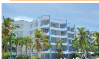
HOTEL COSTA LARIMAR