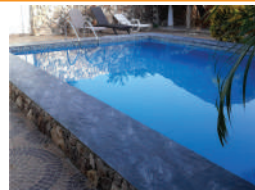
VILLAS DON FEY Y ANDRÉS