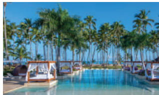
VIVA WYNDHAM V SAMANA