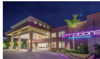
EMOTIONS PLAYA DORADA