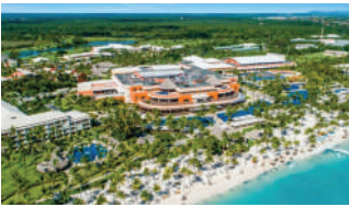
BARCELO BAVARO PALACE