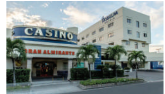
HODELPA GRAN ALMIRANTE