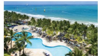
VIVA WYNDHAM TANGERINE