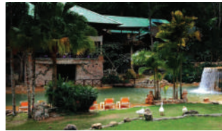
PARAISO CAÑO HONDO