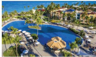
OCEAN BLUE & SAND