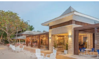
BAHIA PRINCIPE GRAND EL PORTILLO