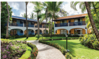
CATALONIA GRAN DOMINICUS