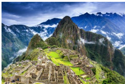
CIUDADELA DE MACHU PICCHU

DÍA 5 - VALLE SAGRADO - CIUDADELA DE MACHU PICCHU. Desayuno en el hotel. Traslado para la estación de tren de Ollanta para abordar el tren regular con destino al poblado de Aguas Calientes. Llegada, recepción y asistencia para abordar los buses para realizar el ascenso hasta El Santuario Histórico de Machu Picchu, iniciaremos la visita observando el grandioso paisaje que la rodea. La excursión es de 2 horas, al término del cual descenderemos hacia el poblado de Aguas Calientes para realizar compras. Almuerzo en restaurante local. A hora programada se abordará el tren de retorno con destino a la estación ferroviaria de Ollanta. Llegada, recepción y traslado al hotel en Cusco.