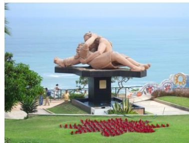
PARQUE DEL AMOR

DÍA 3 - LIMA - CUSCO - VALLE SAGRADO. Traslado para el aeropuerto de Lima para abordar el vuelo con destino a la Ciudad del Cusco. Llegada, recepción y traslado al hotel localizado en el Valle Sagrado para una mejor aclimatación con la altura. En el trayecto visita al mercado artesanal de Pisac, uno de los más conocidos del Perú y al medio día Almorzaremos al estilo buffet en un excelente restaurante turístico en el pueblo de Urubamba. Llegada al hotel, check-in y descanso. Resto del día libre.