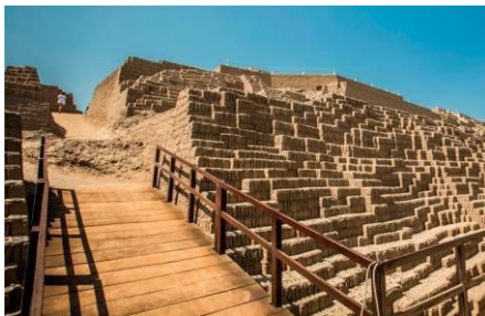
COMPLEJO ARQUEOLÓGICO HUACA

DÍA 2 - LIMA. CITY TOUR LIMA CON CONVENTO DE SANTO DOMINGO. Desayuno en el hotel. Por la mañana iniciaremos nuestro recorrido por el barrio de Miraflores. Nuestra primera parada será el famoso Parque del Amor, un ícono de la ciudad y desde donde se tiene una linda vista de la bahía de Lima. Luego una visita panorámica al Complejo Arqueológico Huaca Pucllana. Continuaremos nuestro recorrido hacia el Centro Colonial, observando la Plaza Mayor, Palacio de Gobierno, la Basílica Catedral, Palacio Arzobispal y Municipalidad de Lima. Así mismo, visitaremos el Convento de Santo Domingo, cuyos pasillos fueron transitados por San Martín de Porras y Santa Rosa de Lima en el siglo XVII, y donde actualmente yacen sus restos. Al finalizar retorno al hotel. Como fin de nuestro tour aprenderemos a preparar el delicioso Pisco Sour para posteriormente degustar de esta bebida bandera de la capital limeña. Al finalizar retorno al hotel.