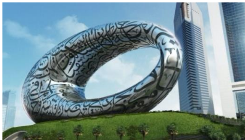
MUSEO DEL FUTURO

7° DÍA DUBÁI. Desayuno en el hotel. Check out y traslado al aeropuerto con asistencia de habla hispana.