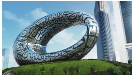
MUSEO DEL FUTURO

7° DÍA DUBÁI. Desayuno en el hotel. Check out y traslado al aeropuerto con asistencia de habla hispana.